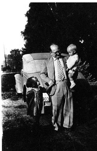
Bild (2): Dr. Carl Clauberg und seine Kinder

Dr. Carl Claubergs Rolle in der Durchführung von Sterilisationsexperimenten in Auschwitz war maßgebend: Nicht nur war er Auschwitz' führender Gynäkologe und genoss die Unterstützung Heinrich Himmlers, er war zudem auch angesehener Wissenschaftler, Mitarbeiter des Schering Konzerns und Mitentdecker zweier bahnbrechender Hormone: Progynon und Prolyton. 35